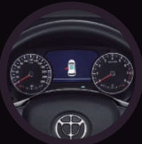
Computador a bordo 7,5"