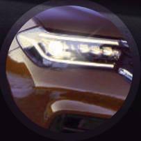
Luces Matrix LED Delanteras