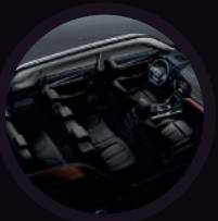
Capacidad de 7 pasajeros