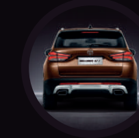
Alerón posterior con detalles cromados y doble salida de escape