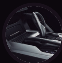
Transmisión automática 7 velocidades + reversa DCT (Getrag)