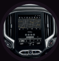
Pantalla de infoentretenimiento 10,4"

Te mereces simplemente la mejor experiencia a bordo, por esto Brilliance V7 está equipado con un Sistema de aire acondicionado automático de doble zona con climatizador, y controlable desde la pantalla touch que incluye un filtro de polen para prevenir alergias a los ocupantes y un aire limpio en cabina. Sistema inteligente "start – stop" que apaga y enciende el motor sin generar consumos extras de combustible y vidrios con protección de rayos UV para cuidar tu piel, el interior de tu V7 y filtrar el calor.