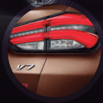
Imponentes luces LED posteriores