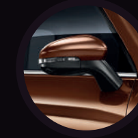
Retrovisores abatibles eléctricamente