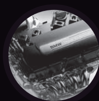
1.6 Turbo GDI VVT - BMW Group Technology

La fuerza controla la fuerza. Brilliance V7 no tiene comparación, equipado con un motor BMW Group Technology 1.6L Turbo con 201 HP y un torque de 280 n/m que brinda una increíble capacidad de aceleración de 0 a 100 km. / h en 8.7s. Combinado con una transmisión automática GETRAG doble embrague de 7 velocidades, y una suspensión posterior multilink independiente que mejora notablemente el control de vehículo y reduce por completo la sensación de impacto en carretera. Todo esto, sumado al control total del vehículo gracias a su formidable nivel de seguridad 5 estrellas en el que se incluyen Sistema de frenos ABS + EBD + BAS, y en cuanto a su estabilidad cuenta con control de tracción (TCS), apoyado de sistemas de última tecnología como: Sistema de control antivuelco (ARM), Sistema de Monitoreo de Presión Neumáticos (TPMS), Sistema Freno de Mano Electrónico (EPB), Asistente de arranque y descenso en pendientes y función autohold.