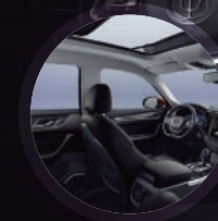
Asientos, panel interior y detalles interiores de Cuero Premium