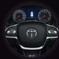
Volante multifunción forrado en Cuero Premium ajustable a 4 posiciones