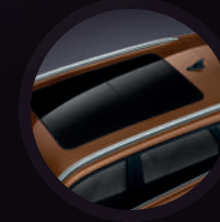
Techo panorámico fijo con cortina eléctrica