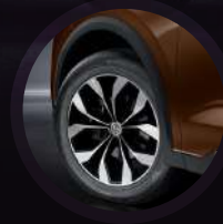
Aros de aluminio de 19"