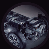
Sistema de dirección electrónica ESP